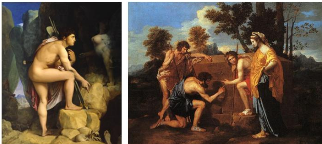
Fig. 5. Nicolas Poussin. Os Pastores da Arcádia . 1650-1655, Óleo sobre tela, 87 x 120 cm, Paris, Louvre.