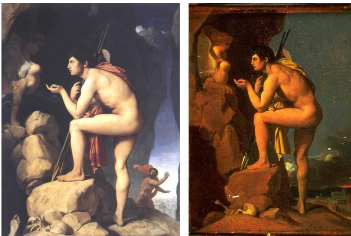
Fig. 1. J. D. Ingres, Édipo Resolve o Enigma da Esfinge , 1808, Óleo sobre tela, 189 x 144 cm, Paris, Louvre

Entre diversas versões produzidas no decorrer de sua vida, Ingres voltaria ao tema em 1864, quando já contava mais de oitenta anos. Em Édipo e a Esfinge , o pintor inverte a composição, como se pretendesse produzir um espelho da tela anterior (Fig. 5). A principal diferença entre as duas versões é o fato da segunda retratar o crescente pavor do monstro mítico diante da resolução do enigma por parte do herói. Além disso, se o Édipo pintado na juventude apontava sua atenção gestual e ocular para os aspectos femininos do monstro, a versão posterior indica os ossos dos mortos, como se prenunciasse a morte do próprio pintor, três anos mais tarde.